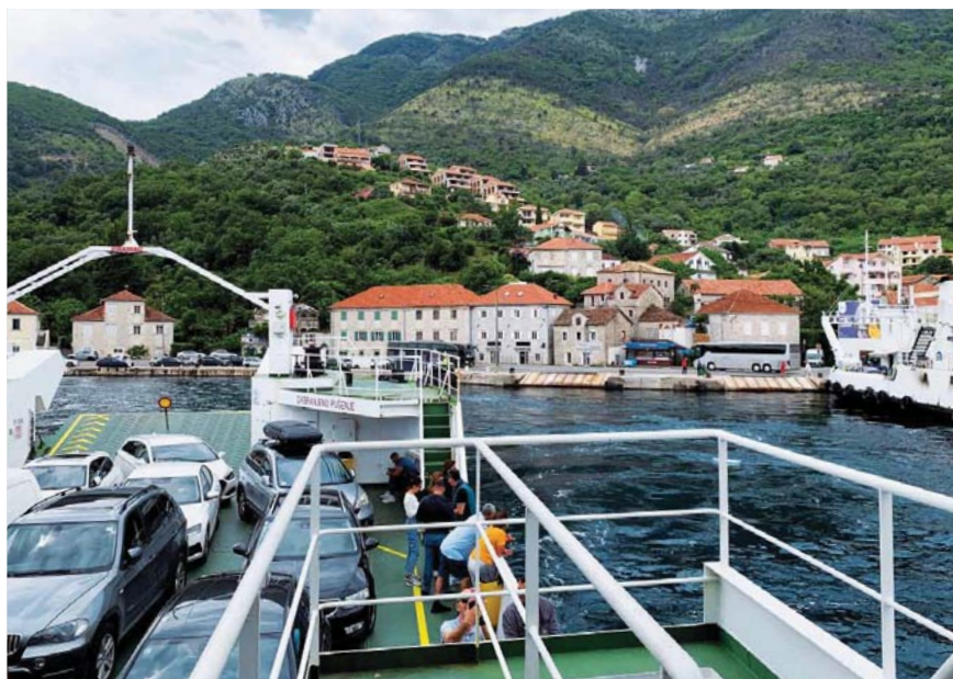
Trajekt přes boku Kotorskou

Ráno v osm stojíme s Ondrou a se všemi dokumenty od lodi a pasy u budky, kde se platí vzdušné. Po chvíli zpoždění je otevřeno, je odbaven jediný klient před námi a po kávičce, kterou si úřednice jde uvařit a vypít vedle, přicházíme na řadu. Zhruba o půl deváté se dozvídáme, že podle slečny nejsme v Černé Hoře, protože nemáme v pasech razítka z hranic. Zajímavá úvaha. Za prvé, do Černé Hory se dá jet na občanku, a za druhé, i když jsme někteří ukazovali pasy, „pozemní“ celník nám tam stejně razítka nedal. Ale úřednice trvá na svém, prý musíme počkat do zítřka, až přijde inspektor, který nás proclí a dá nám potřebná razítka. Je neoblomná, anglicky se dohadujeme a teprve až na Ondrovy výhrůžky, že půjdeme k soudu, aby nám zaplatili ztrátu jednoho dne, že už jsme chtěli odjít do Albánie včera, koho že můžeme zažalovat, se úřednice lekne a řekne, ať tedy jedeme, že to vyřídíme, jak se vrátíme. Máme všechny potřebné doklady, tak se jdeme do vedlejší budky celníků zeptat, jestli nás vyclí z Černé Hory. Ale to oni můžou, až když přijedeme k celnímu molu i s lodí.