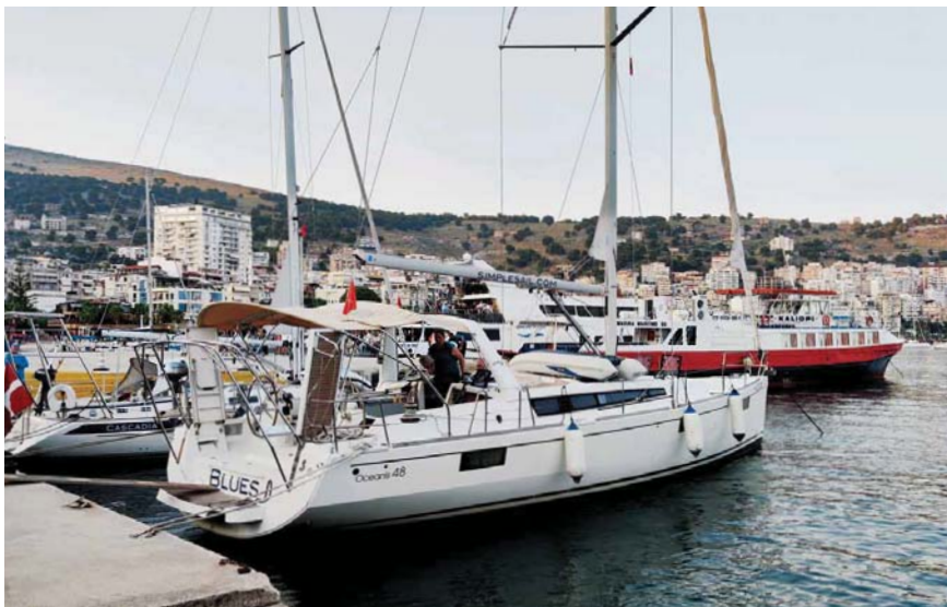
Celní molo v Sarandë

prvním zakotvení jsem to pod vodou zkontroloval a zjistil jsem, že je hloubka jistě měřená od kýlu lodi s velkou rezervou. Nechtěl jsem jim sahat do nastavení, a tak jsem k uváděné hloubce připočítával čtyři metry. Bizarní bylo, že při zkoumání mělčin na jihu