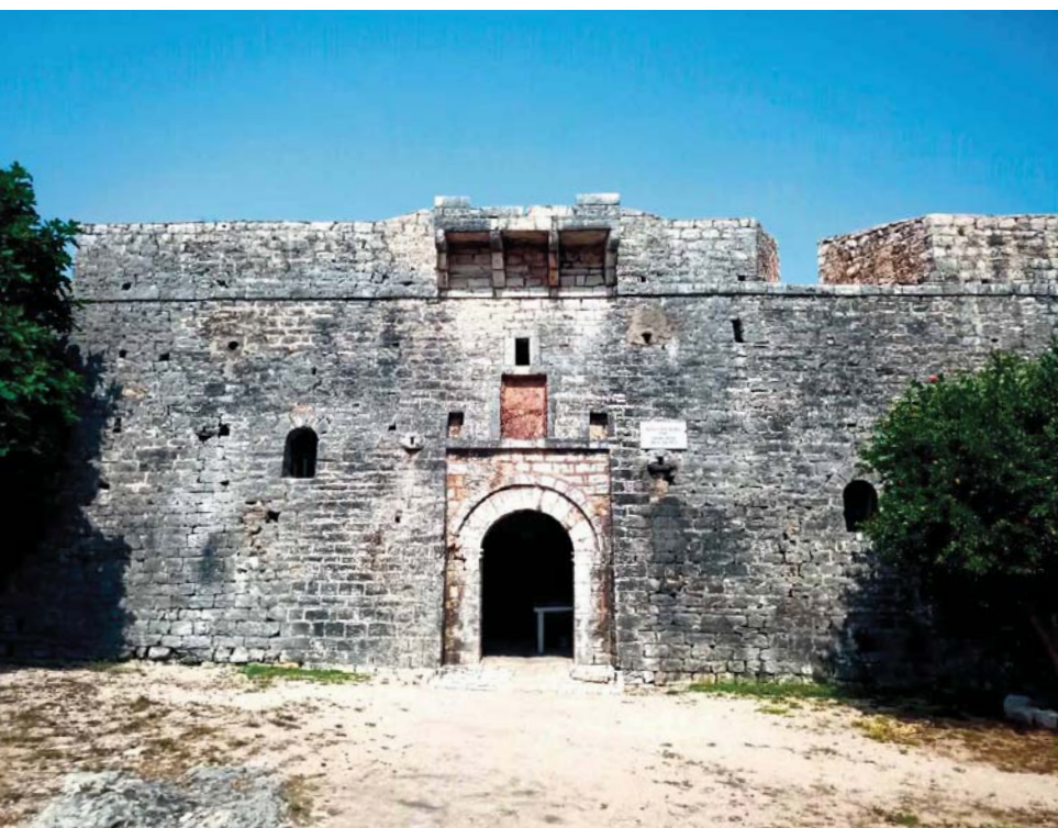
Pevnost v Porto Palermu

Ráno využívá část posádky k návštěvě místní pevnosti Ali Paši Tepelenského (Ali Pasha Tepelena Fortress). Pevnost je velmi podobná té u vjezdu do Šibeniku, kterou jistě mnoho námořníků zná. Neobvyklá je