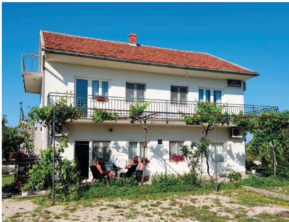
Ubytování po cestě jsme měli domluvené v Šibeniku.

Vzhledem k tomu, že jsme přespali v Chorvatsku, jsme byli v marině již v půl třetí odpoledne. V propozicích byl nahlášen check-in od sedmnácti hodin, tak jsme nijak nespěchali. Už jen najít kancelář podle mapky byla docela bojovka a bez telefonu bychom ji asi nikdy nenašli. Na místě jsme se dozvěděli, že je loď nachystaná, máme si projít papíry k check-inu a můžeme se nalodit. Pak prý někdo přijde, dokončíme check-in a předá nám doklady