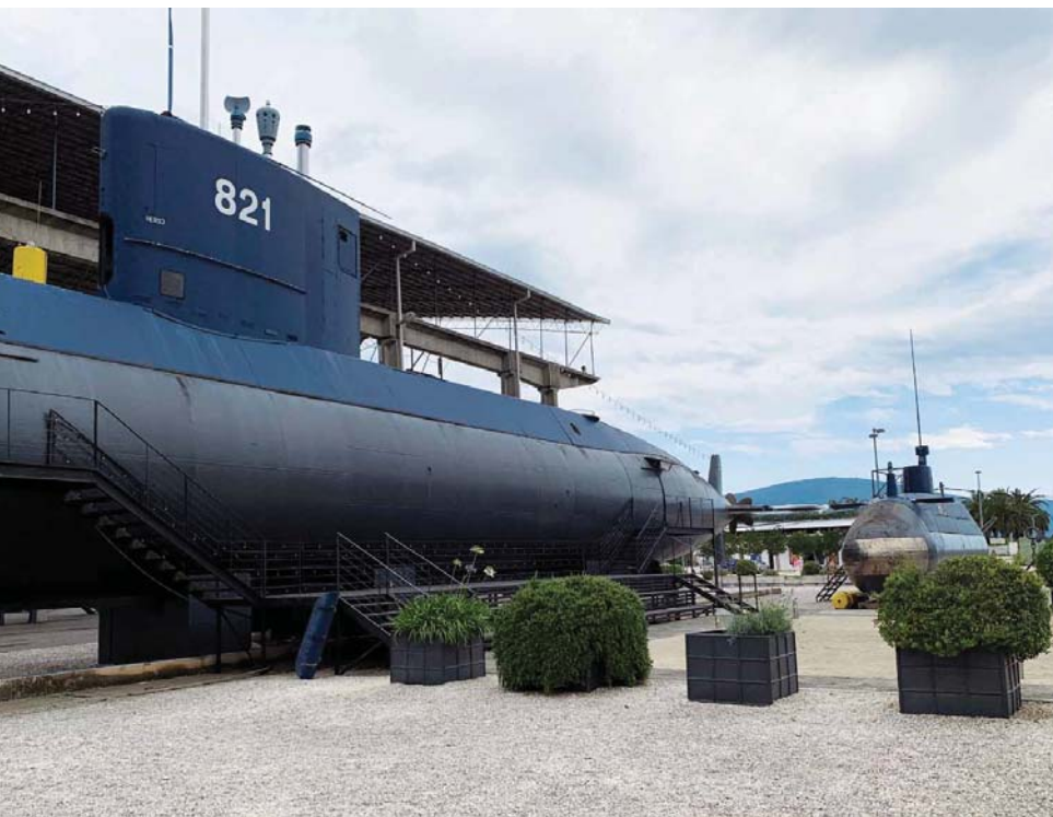
Ponorka v marině Tivat