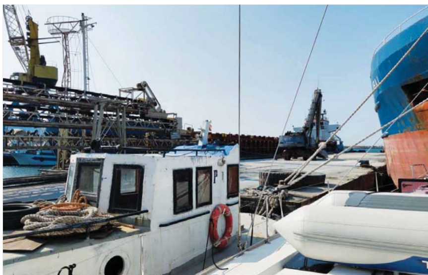
Celní molo v Shëngjinu

Naše zkušenost a doporučení v těchto zemích je nosit pasy raději všude s sebou, hlavně při jednání s celníky i při kotvení v marinách.